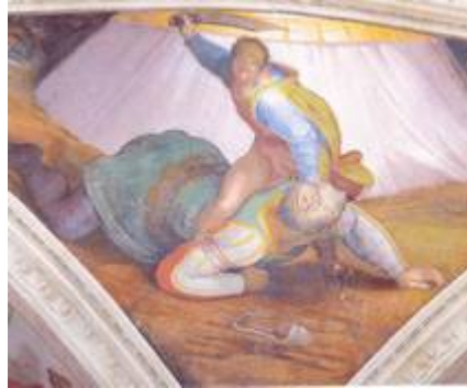
David et Goliath (chapelle Sixtine)

Belle référence, en vérité, que d'avoir manqué à la mémoire de leur évêque consécrateur, à l'idéal de la Fraternité et d'avoir été sanctionnés par le successeur du fondateur!