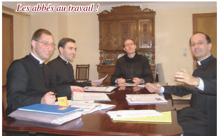
Les abbés au travail !

Nous vous remercions de l'aide que vous apporterez à ce grand projet d'installation du futur prieuré à Nancy.