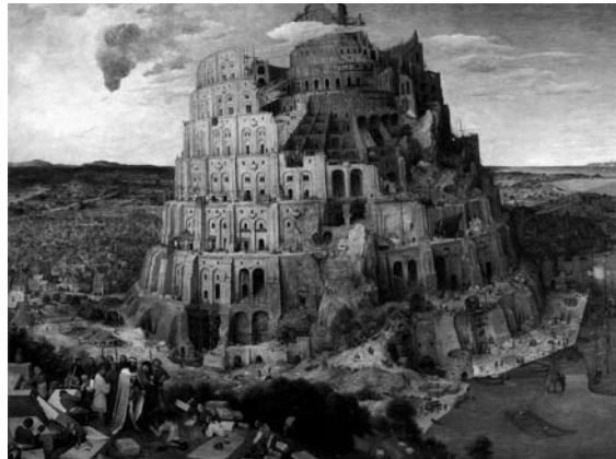
La tour de Babel

Le cardinal Pie la décrit en quelques mots : "Quinze siècles après Arius, l'arianisme plus absolu, plus radical, a relevé la tête et il se nomme le naturalisme. Négation de tout ordre et de tout être surnaturel, c'est-à-dire de tout élément supérieur à la nature créée ; par suite déification de l'homme substitué à Dieu : voilà toute la thèse philosophique, scientifique, politique de l'impiété contemporaine.