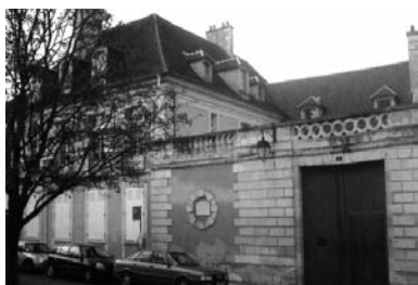
Bâtiment de Marie-Auxiliatrice Place George Sand à Bourges

Siège donne son approbation officielle. L'œuvre des jeunes ouvrières retient tout spécialement l'attention du pape Pie IX : "Nous félicitons la nouvelle famille religieuse de venir en aide à celles qui obligées de gagner leur vie par le travail des mains, se trouvent exposées, loin de la maison maternelle, à de plus fréquents et graves dangers." Puis l'évêque d'Amiens sollicite une fondation dans sa ville : "J'adhère à tout ce que vous me proposez pour la sanctification de ces pauvres enfants. Quand nous voyons les ennemis de l'Église s'acharner contre elle, je regarde votre œuvre comme l'une des plus précieuses et des plus nécessaires de ces temps-ci". C'est la première fondation de Marie-Auxiliatrice hors de Toulouse, puis vont en suivre d'autres : Paris, Angers, puis Bourges.