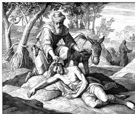
L'homme à demi-mort représente Adam et l'humanité blessés par le péché originel.

vous appelez vos plaies, tout cela n'est qu'un effet de votre imagination, travaillée par des préjugés d'enfance. Dépouillez-vous de tout ce bagage ; nous travaillerons ensuite à vous faire connaître, estimer et suivre la nature. Ses aspirations sont justes et bonnes ; le développement de vos facultés natives vous en convaincra de plus en plus. Ne dites pas que vous avez des plaies ; ne croyez pas à ce que vous appelez de la fièvre ; quant à cette soif, nous avons des calmants ... Vous n'êtes pas malade.